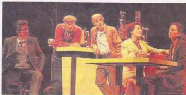
Cinq travailleurs discutent dans un café de leur relation avec leur « boîte ».

Montrer l'importance de l'intelligence collective dans le monde de l'entreprise : on doit pouvoir échanger nos savoirs, être en lien entre nous. On privilégie la productivité à l'humain, c'est désastreux. Beaucoup d'employés ne se